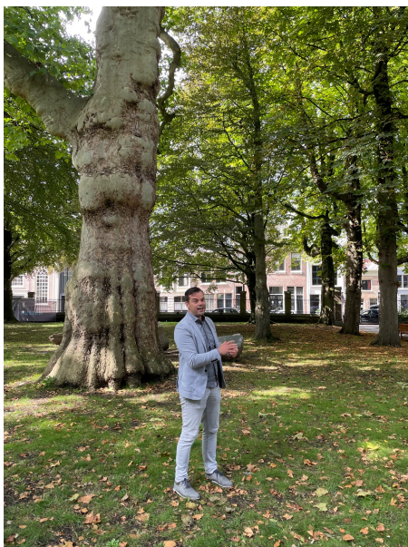
De Dordtse stadsecoloog